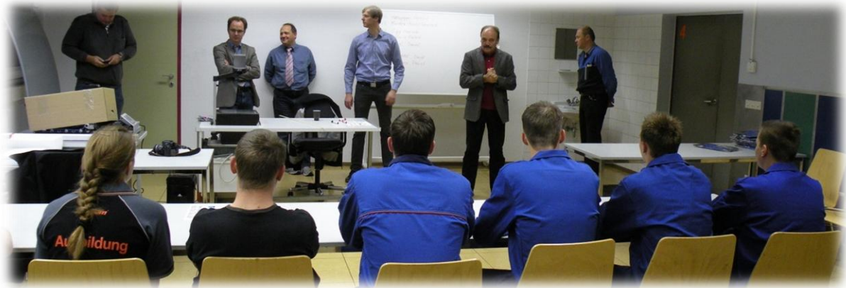
Die Fachjury präsentiert die Wettbewerbsaufgabe