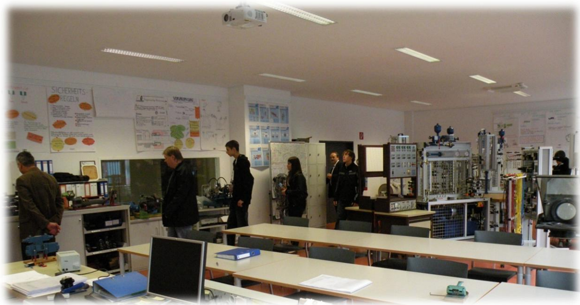
Ausbildungslabors nach Stand der Technik dürfen aus nächster Nähe „begriffen“ werden